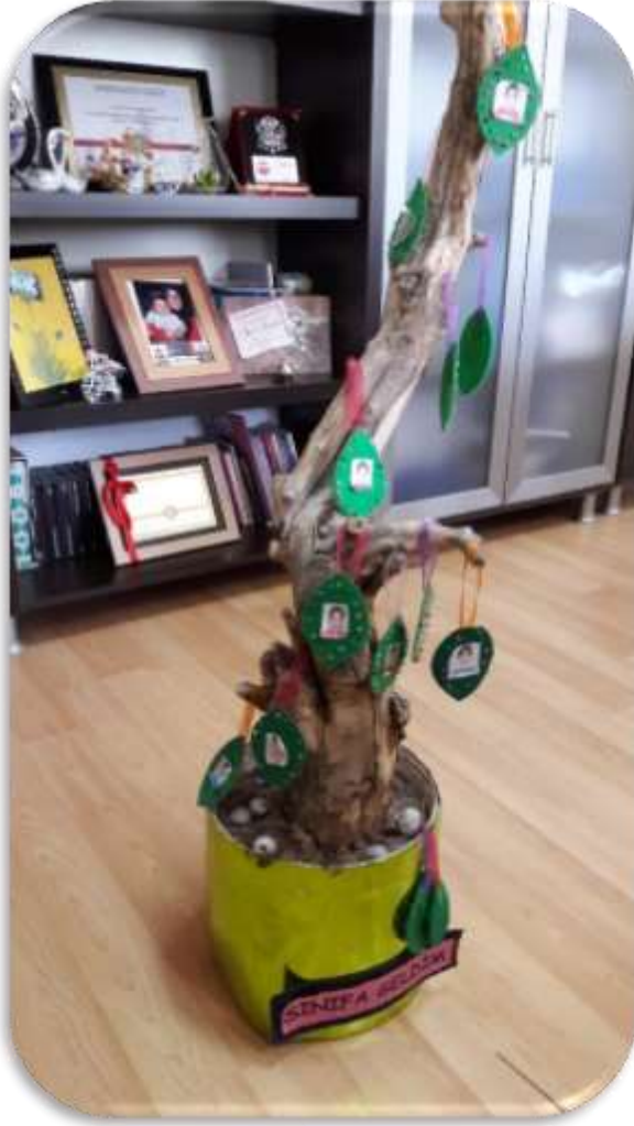
Öğretmen Sinem DEĞİRMENÇİ

Sınıf ve Program İsimliklerinin Formlarını Değiştirelim!