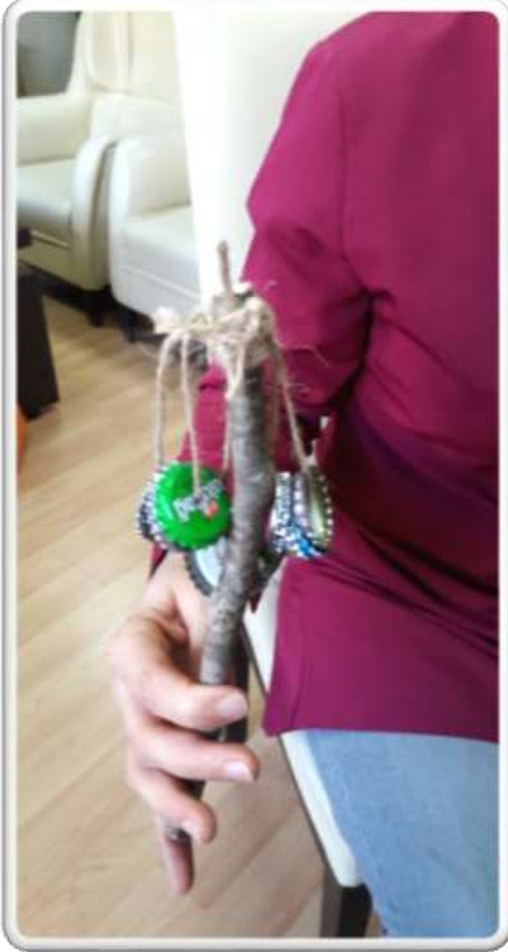
Öğretmen Nursel ATA

Yapılışı: Silikonla ipi cevizlerin içinde kalacak şekilde sabitleyip, çubuklara bağlanır. Aynı şekilde gazoz kapakları delinir, ipten geçirilir ve çubuklara bağlanır.