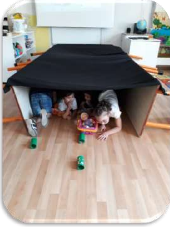
Öğretmen Sinem DEĞİRMENÇİ