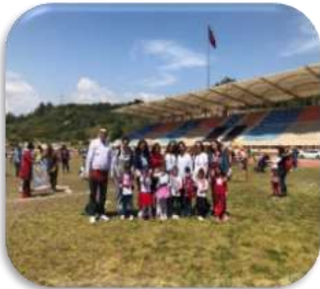
Ailelerle Uçurtma Şenliği